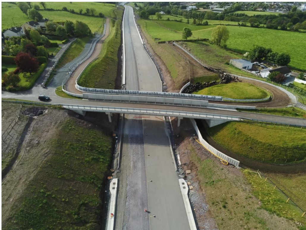
Ba ag trasnú, Gearradh 11, ó thuaidh ó Mhaigh Chromtha..

Baile margaidh is ea Maigh Chromtha i gContae Chorcaí, Éire, suite ar bhruacha Abha an tSuláin , leath-bhealaigh idir Chathair Chorcaí agus Cill Áirne. Freastalaíonn an baile ar cheantar i lár Chorcaí a bhfuil saibhreas talmhaíochta agus táirgeadh bia aige, a dhéantar a cheiliúradh chomh maith mar chuid d'Fhéile Bhia bhliantúil Mhaigh Chromtha. Tá roinnt ealaíontóirí, grúpaí ealaíon agus eagraíochtaí lonnaithe sa bhaile lena n-áirítear amharclann Briery Gap atá á athchóiriú faoi láthair.