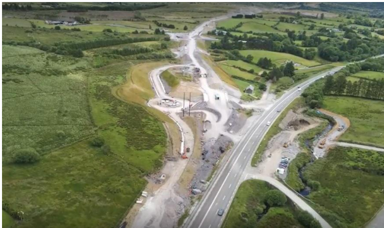
Acomhal Bhaile Bhuirne / Ceangail Isteach Thiar Grianghraf: Foireann dordán Chomhairle Contae Chorcaí