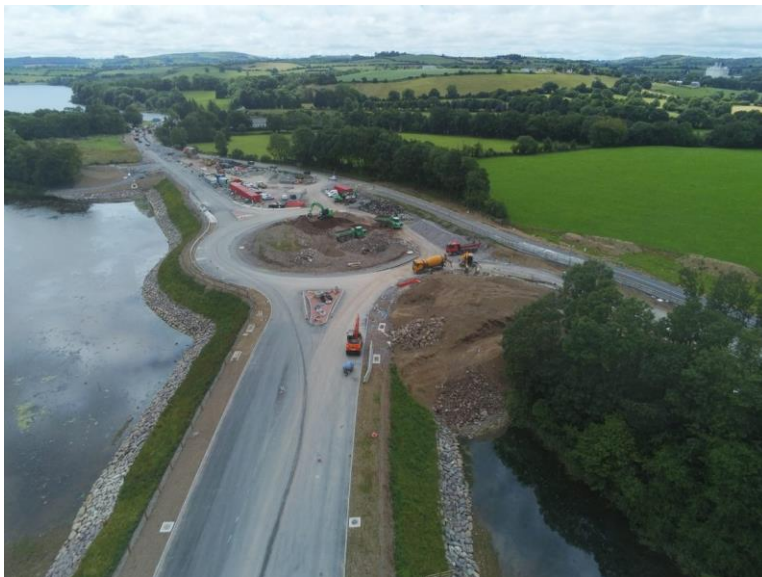
Acomhal Chúil Chomhair

Is féidir píosaí scannáin dordáin den fhorbairt atá ar siúl a fheiceáil anseo: https://youtu.be/A0uHFSqHY2g