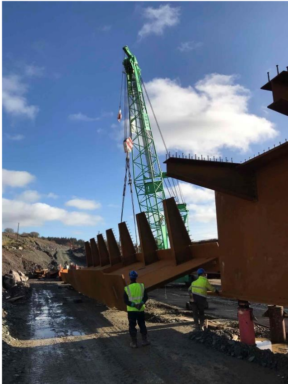
Droichead Abha na Biochaille.

Soláthraíonn forbairt an N22 feabhsúchán bóthair 22 km ó thaobh Chorcaí de Mhaigh Chromtha, ag dul timpeall ar bhaile Mhaigh Chromtha, sráidbhaile Bhaile Mhic Íre agus Baile Bhuirne, lúba áitiúla Bhaile Bhuirne, agus ag críochnú ar an gcuid feabhsaithe den N22, in iarthar pharóiste Bhaile Bhuirne agus roimh theorainn an Chontae le Ciarraí.