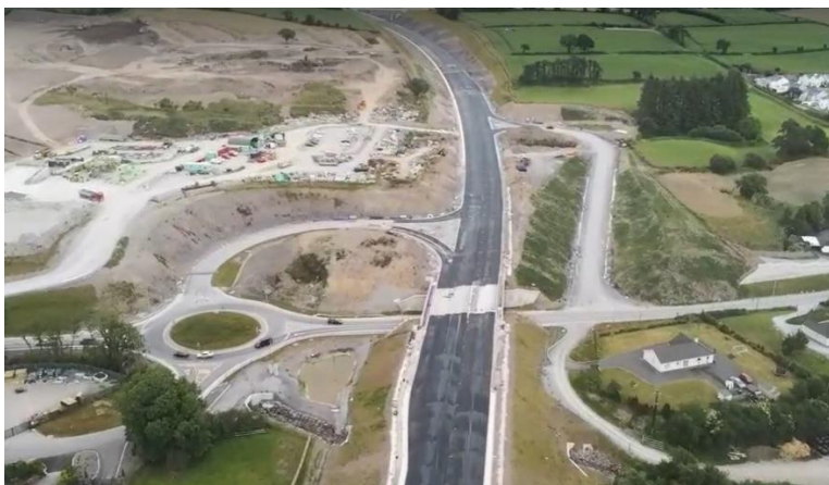
Acomhal an Ghoirtín Rua