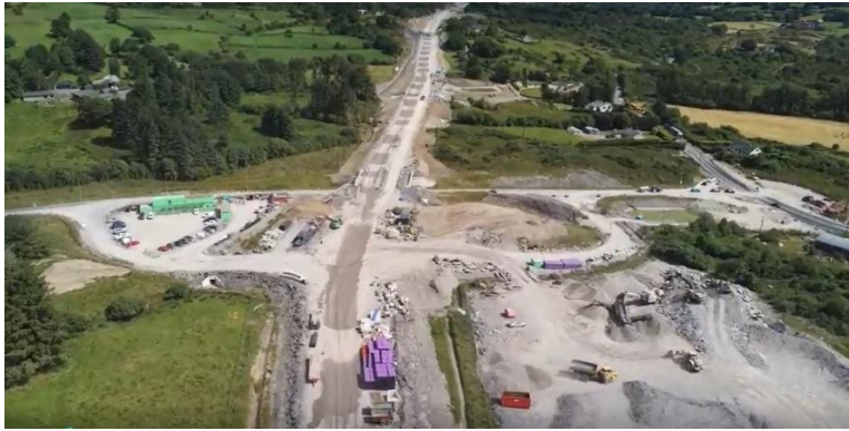
Acomhal Thonn Láin Grianghraf: Foireann dordán Chomhairle Contae Chorcaí