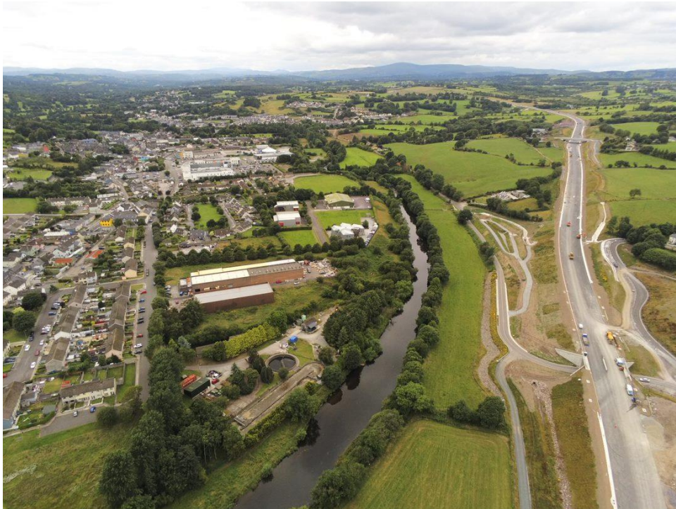
Mhaigh Chromtha.

Tá Caisleán Charraig an Phúca suite ar an gcarraig ar a dtugtar Carraig an Phúca gar do Mhaigh Chromtha, Contae Chorcaí. Túr ón 16ú haois atá ann le 4 stór faoi dhíon bogtach agus túiríní ar chúinní trasna óna chéile ag a bharr. Ba é Diarmaid Mór Mac Cárthaigh a thóg é am éigin idir 1436 agus 1451. Cuireadh staghre leis sna 1970'aí. Tá ciorcal cloiche dhá pháirc lastoir den chaisleán.