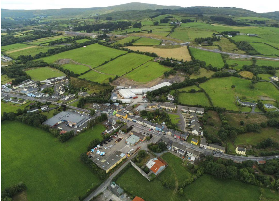
Baile Mhic Íre.

Tá an Gaorthadh gar do Mhaigh Chromtha. Tá éagsúlacht mhór iasc, éan, crann, plandaí agus ainmhithe mar an cruídín, an dobharchú agus an ealaí glóracha san éiceachóras éagsúil seo. Is í an t-aon fhoraois ghlárach iar-oighreach ársa atá fágtha in Iarthar na hEorpa. Anaclann dúlra reachtúil is ea í ó 1987 agus tá sí mar chuid de scéim Hidrileictreach Abhainn na Laoi chomh maith. Is gnáthóg í an limistéar geografach níos leithne don scéim seo chomh maith do sciatháin leathair, an Drúchtín Ballach, diúilicíní péarla fionnuisce agus ulchabháin. Trasnaíonn forbairt an N22 na páirteanna uachtaracha de Thaiscumar Charraig an Droichid, atá suite ar an Laoi, atá suas an abhainn ón dá stáisiún hidreachumhachta. Baineann an loch go príomha le garbhascaireacht le haghaidh bran, ruán, róiste, liús agus péirse.