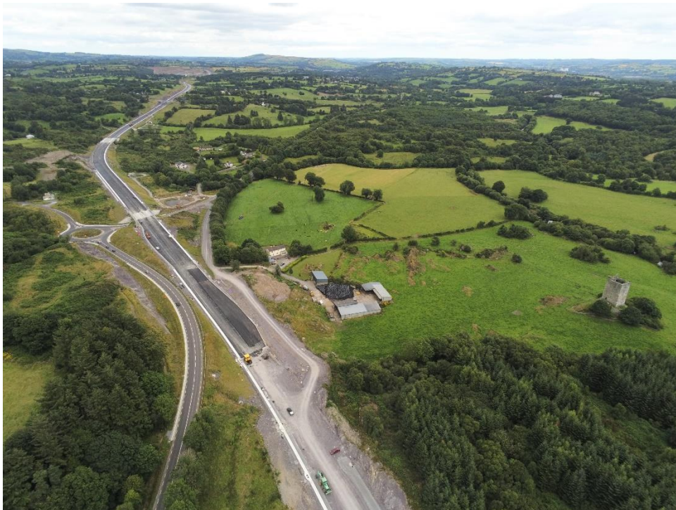
Caisleán Charraig an Phúca

Tá Caisleán Charraig an Phúca suite ar an gcarraig ar a dtugtar Carraig an Phúca gar do Mhaigh Chromtha, Contae Chorcaí. Túr ón 16ú haois atá ann le 4 stór faoi dhíon bogtach agus túiríní ar chúinní trasna óna chéile ag a bharr. Ba é Diarmaid Mór Mac Cárthaigh a thóg é am éigin idir 1436 agus 1451. Cuireadh staghre leis sna 1970'aí. Tá ciorcal cloiche dhá pháirc lastoir den chaisleán.