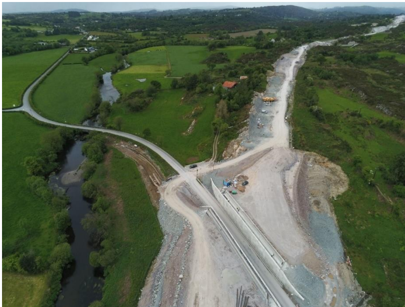
Bóthar Chill na Martra.

Tá Ionad Cultúrtha an Dochtúra Uí Loingsigh ina ionad ealaíon a fhreastalaíonn ar Ghaeltacht Mhúscraí, agus tá sé seo lonnaithe i mBaile Bhuirne. Cuireann sé clár ealaíon ar fáil ó cheann ceann na bliana lena n-áirítear amharcealaíon, ceol, cónaitheachtaí d'ealaíontóirí ar chuairt agus cúrsaí don phobal i gcoitinne.