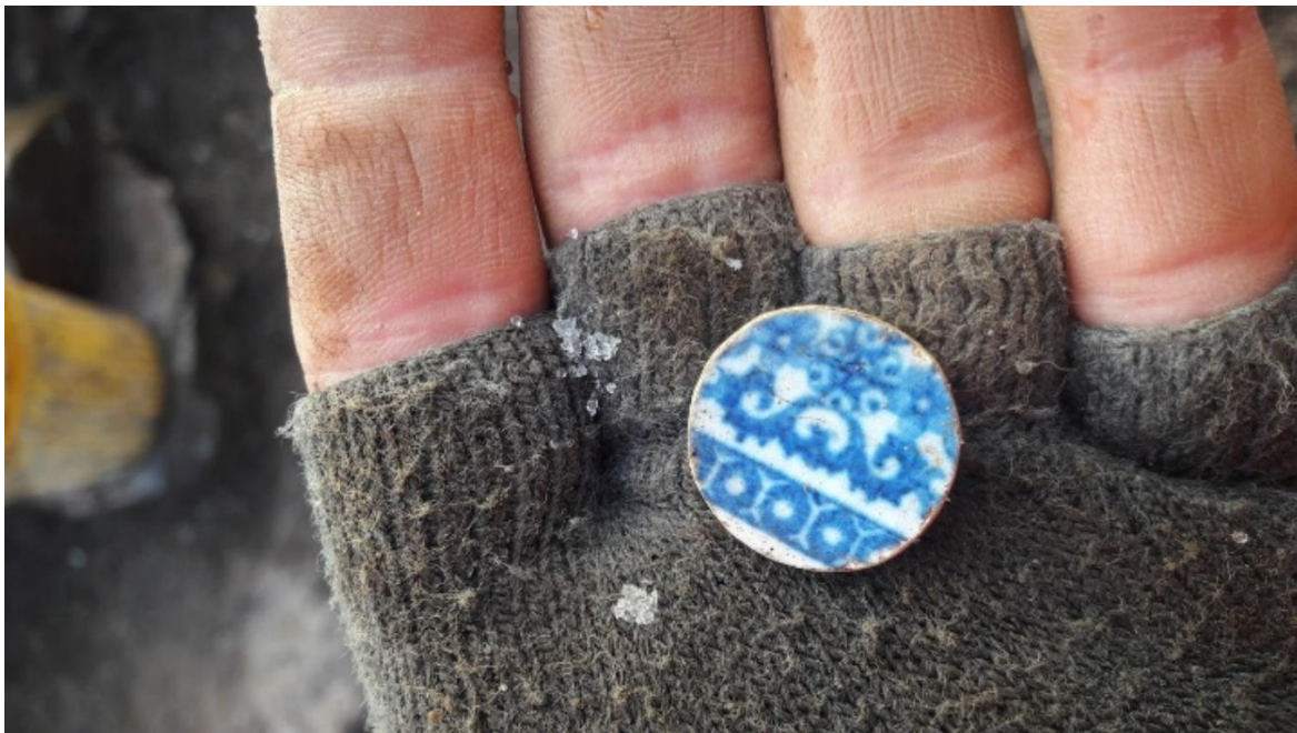
Píosa Cearrbhachais Ceirmeach a aimsíodh i gCill an Chloig 1

Tochlaíodh 25 láithreán ó thréimhse na réamhstaire fan bhealach an N22 nua sular thosaigh an tógáil. Is é a bhí sa chuid is mó díobh seo ná tulacha dóite ón gcré-umhaois nó fulachta fiadh , saghas suímh dhúrúnda inar téadh clocha i dtine sula gcuirtí in umar ullmhaithe agus lán d'uisce, arb é an cuspóir ná an t-uisce a théamh ar chúiseanna éagsúla, folcadh nó cócaireacht an míniú is dóichí i bhformhór na gcásanna. Is minic a bhíonn trachanna dá leithéid a bhí taobhaithe le cloch nó le hadhmad, agus bhí go leor samplaí coimpléascacha le taobhú adhmaid dea-chaomhnaithe le feiceáil san áit seo. Fuarthas na suíomhanna seo in go leor áiteanna fan na scéime. I measc na suíomhanna réamhstairiúla eile bhí adhlacadh créamtha do bhean óg ón gcré-umhaois.